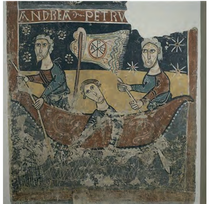
La pesca miraculosa (església de Sant Pere de Sorpe)