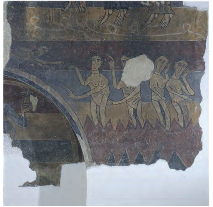
Els condemnats. Judici final (Santa Maria de Taüll)