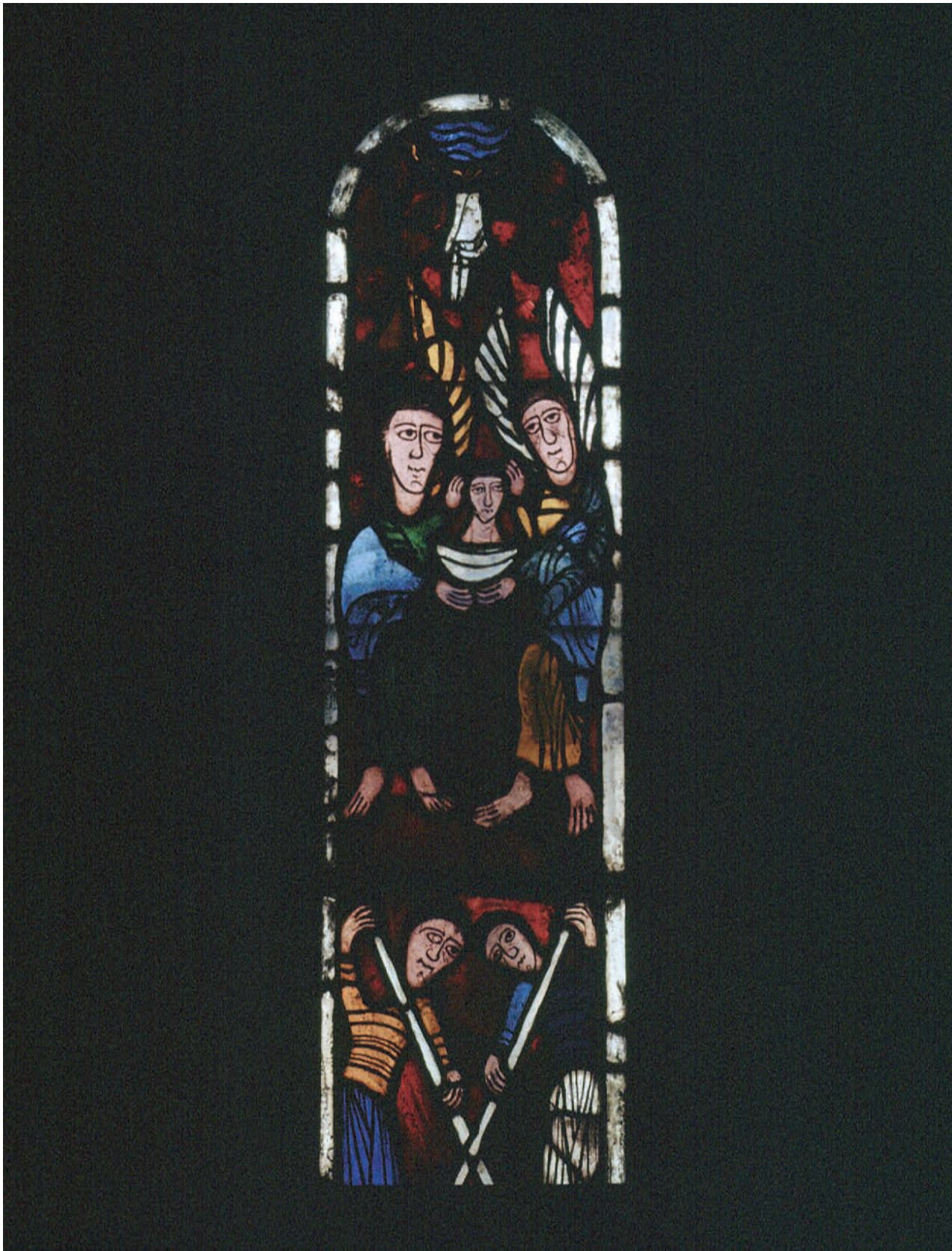
Vitrall de Worcester. EEVO. Martiri de sant Llorenç o sant Vicenç