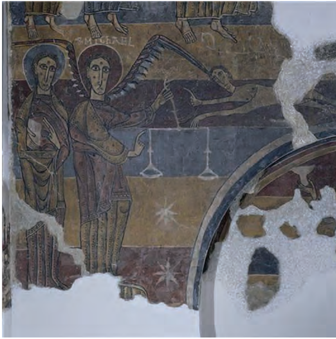
Arcàngel sant Miquel. Judici final (Santa Maria de Taüll)