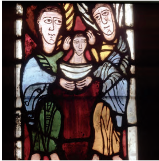
Ascensió de l'ànima