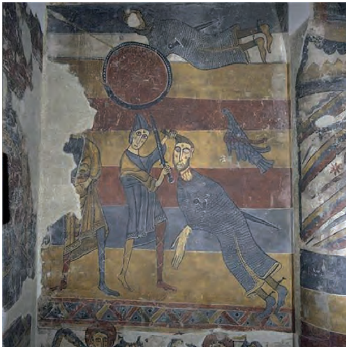
David i Goliat (Santa Maria de Taüll)